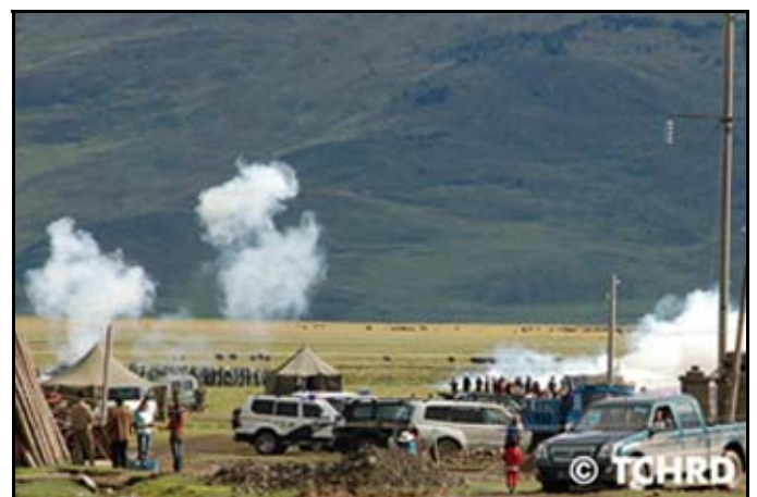
PAP-Fahrzeuge in Lithang und Soldaten