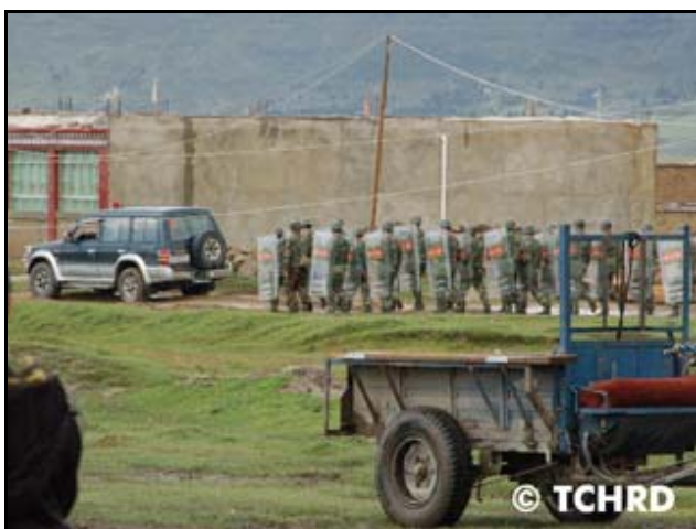
Eine Einheit von PAP-Soldaten in Lithang, die Anti-Terror-Schutzschilder tragen